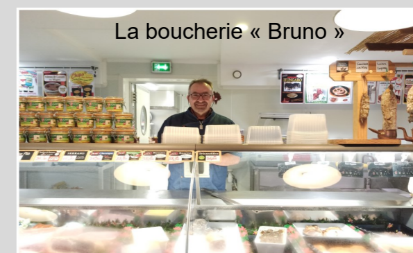
La boucherie « Bruno »