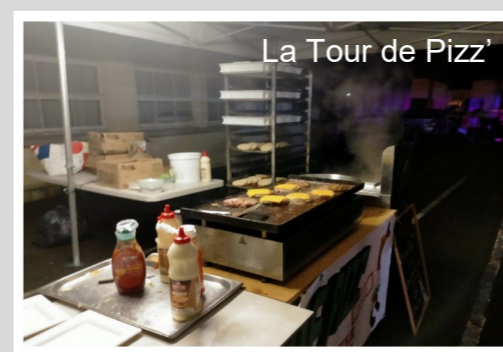
La Tour de Pizz'