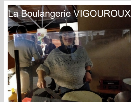
La Boulangerie VIGOUROUX