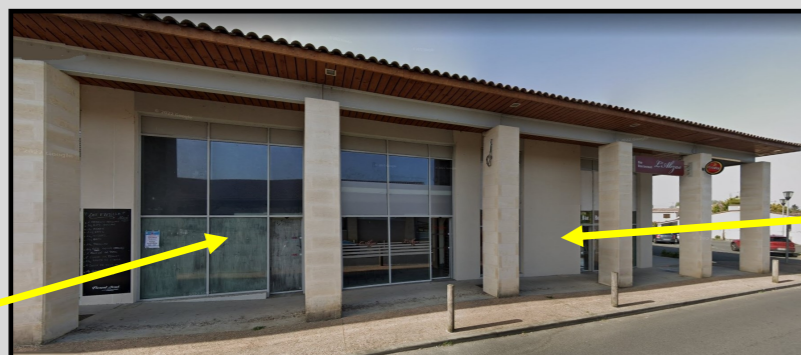
Futur magasin Presse / Tabac / Jeux

Ainsi repositionnés, trois de nos principaux commerces pourront gagner en attractivité et répondre à vos attentes.