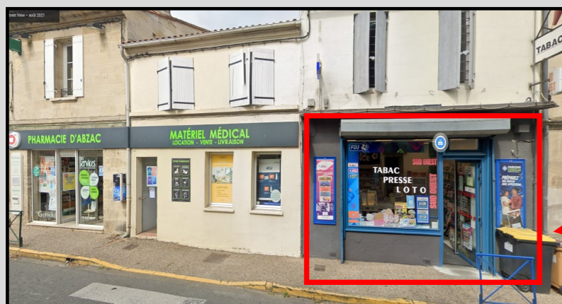
Futur agrandissement de la pharmacie (anciennement Presse / Tabac / Jeux)

Enfin, il offre des télécommunications pour plus de conseils et d'écoute.